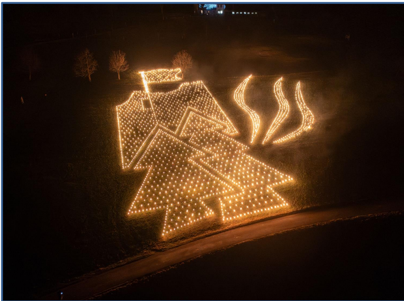
Fackelbild mit Fest-Logo 800J00R